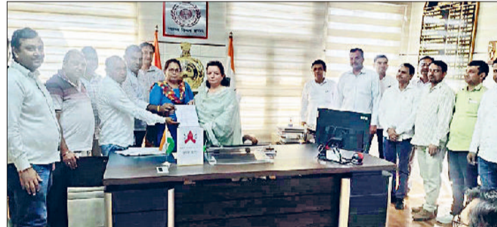
झंझर। सीएमओ को ज्ञापन सौंपते हुए एमपीएचई एसोसिएशन सदस्य।