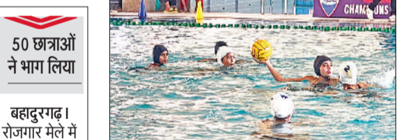
बहादुरगढ़। वाटरपोलो मैच में खेलते करनल और स्पॉर्ट्स यूनिवर्सिटी की खिलाड़ी।