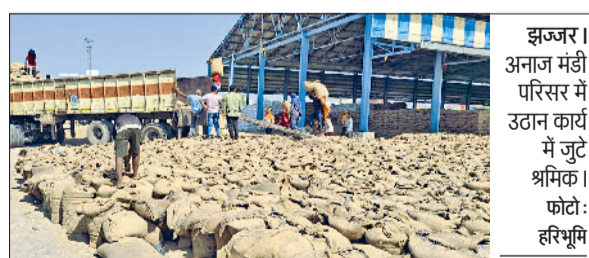
9898 क्विंटल धान की सरकारी खरीद की जा चुकी है। वीरवार को जिले की अनाजमंडियों में सरकारी स्तर पर खरीद प्रक्रिया ठप रही। सरकार खरीद न होने के कारण किसान मायूस रहे। किसानों ने सरकार से जल्द से जल्द धान खरीद प्रक्रिया को सुचारू करने की मांग की है ताकि उन्हें अपनी उपज बेचने में परेशानी न हो। प्राइवेट स्तर पर आदतियों द्वारा बोली लगाकर धान खरीदा जा रहा है। बता दें कि

आदतियों का कहना है कि अनाजमंडी में प्राइवेट स्तर पर धान व बाजरा खरीदा जा रहा है। विभागीय आंकड़ों के अनुसार अब तक जिले की बेंरी व मातनहेल अनाजमंडी में 414 किसानों के पीआर धान के गेट पास काटे जा चुके हैं, जिनकी 20739 क्विंटल धान की आवक ई-खरीद पोर्टल पर दर्ज है। अब तक 202 किसानों की