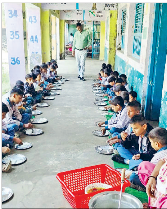
झज्जर। राजकीय प्राथमिक पाठशाला सुखपुर में खीर का आनंद लेते हुए नन्हें विद्यार्थी।