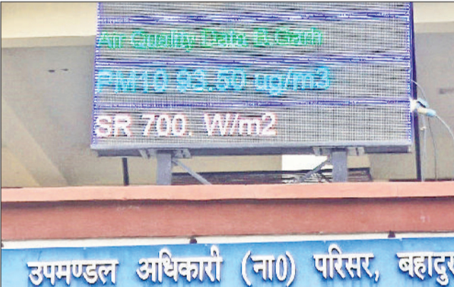
बहादुरगढ़। लघु सचिवालय में साफ हवा दर्शा रहा मॉनिटर।

शहर के लघु सचिवालय में लगा प्रदूषण मापक यंत्र पहले भी लंबे समय तक खराब रहा था। एक बार फिर यह संकेत में नजर आ रहा है।