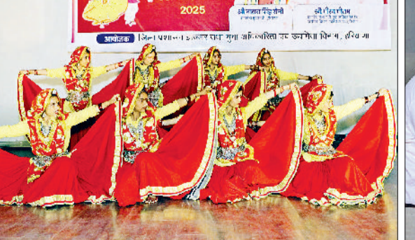
झज्जर। कार्यक्रम के दौरान अपनी प्रस्तुति देते हुए प्रतिभागी तथा दीप प्रज्वलित कर शुभारंभ किया।

व लोक कला को सहेजने में सहायक सिद्ध होते हैं। उन्होंने कहा कि युवा पढ़ाई के साथ-साथ अपनी कला और साहित्य को बचाने के लिए साहित्यिक कार्यक्रमों में जरूर भागीदार बनें। युवा महोत्सव के